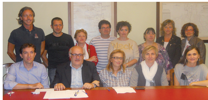
Gli assessori e i volontari del servizio "Piedibus"

ducendo, nel limite del possibile, il numero di automobili intorno alla scuola, ma anche promuovere l'educazione stradale. Essere riusciti