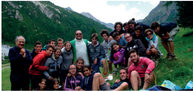
Il campo parrocchiale adolescenti e giovani a Bormio

Tante novità per l'oratorio "San Giovanni Bosco" di Offanengo, e non solo perché presto "cambierà casa" con l'inagurazione della nuovissima e altrettanto bella sede (11 novembre), ma soprattutto perché un oratorio è fatto di persone, idee, proposte ed entusiasmo. Ecco dunque che domani si aprirà ufficialmente il nuovo anno pastorale con la ripresa delle consuete attività (catechismo, ACR) "condite" con tante novità. Si apre un anno intenso... l'Anno della Fede, del cammino verso l'appuntamento della GMG di Rio de Janeiro. Un anno che sarà segnato da relazioni significative, iniziative coinvolgenti, molte occasioni di condivisione.