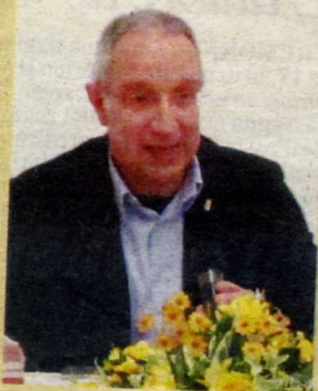
Il presidente Zanisi

Domenica 29 settembre 8.30 visita, in forma privata, al monumento ai Caduti di Cefalonia nel cimitero cittadino e deposizione della corona di alloro.