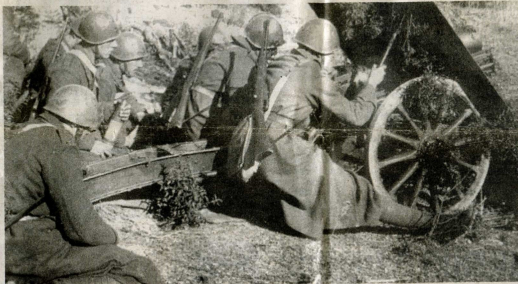
Un'immagine dei soldati italiani a Cefalonia durante il settembre del 1943

celebrazione, verrà consegnata dal sindaco di Verona la cittadinanza onoraria della città alla nostra associazione. La nostra messa di suffragio, invece, verrà celebrata, in via eccezionale, presso la sede degli Alpini, che ospita anche la nostra Associazione. E questa l'occasione per far visitare ai soci la sede e per svolgere poi la nostra assemblea annuale nella